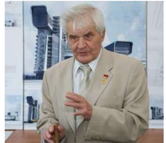
Белянкин Геннадий Иванович

Главный архитектор Екатеринбурга (1973—1996)