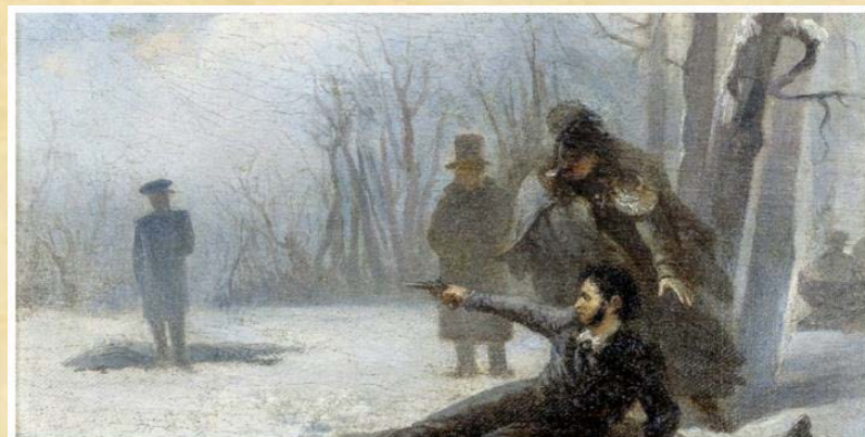
Жорж Шарль Дантес

В 1837 году между Александром Сергеевичем Пушкиным и Жозефом Дантесом произошел конфликт. Пушкин вызвал Дантеса на дуэль, где был смертельно ранен. Спустя два дня Александр Сергеевич Пушкин умер.