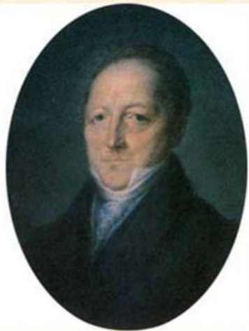
Отец Пушкина — Сергей Львович (1767—1848)

6 июня 1799 года в Москве в небогатой дворянской семье родился мальчик Саша.