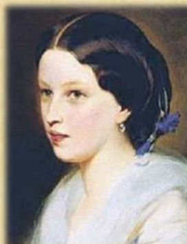
Старшая дочь Мария Александровна Пушкина (1832-1919г.)

У них родилось четверо детей. Александр Сергеевич очень их любил и проводил с ними много времени: читал им, играл и называл их «детушки».