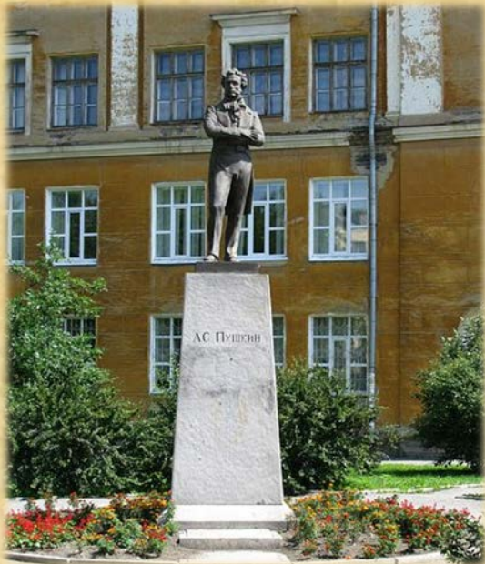
Памятник А.С. Пушкину на улице Машиностроителей

В нашем городе есть два памятника А.С. Пушкину. И, хотя А.С. Пушкин никогда не был в городе Екатеринбурге, жители города знают, помнят и любят его произведения.