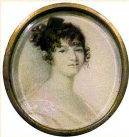
Мать Пушкина — Надежда Осиповна (1775—1836)