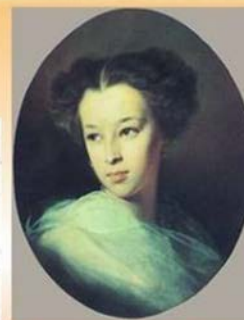
Младшая дочь Наталья Александровна Пушкин (1836-1913г.)