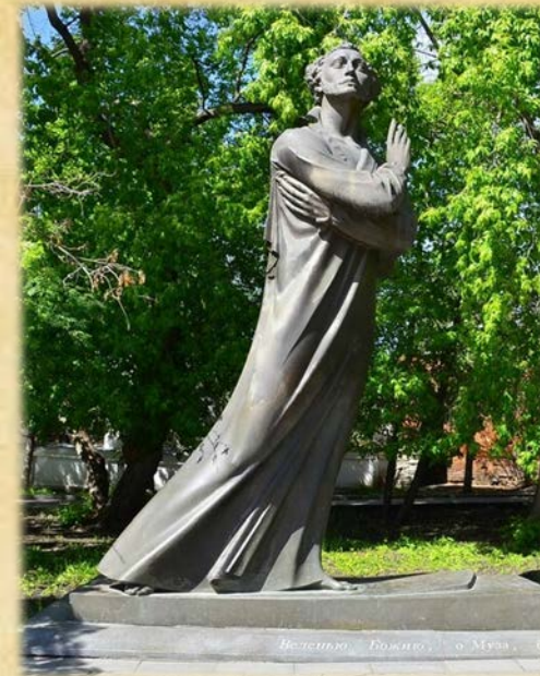
Памятник А.С. Пушкину в Литературном квартале

В нашем городе есть два памятника А.С. Пушкину. И, хотя А.С. Пушкин никогда не был в городе Екатеринбурге, жители города знают, помнят и любят его произведения.