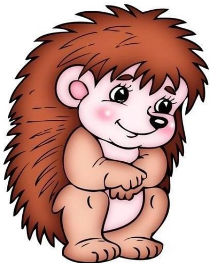
«Сделай колючки ёжику»