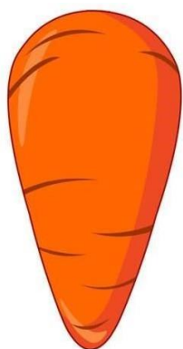
«Ботва у овощей»