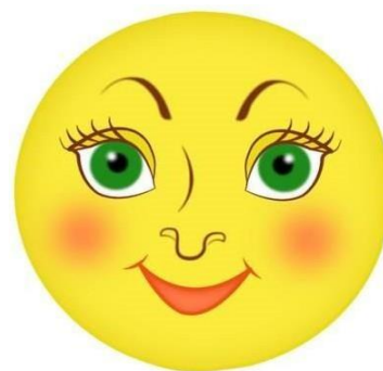
«Сделай лучики солнышку»