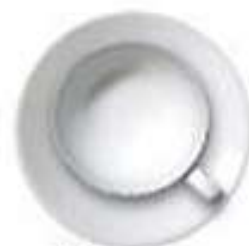
Чашка и блюдечко (десерт)