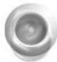
Бокал для воды