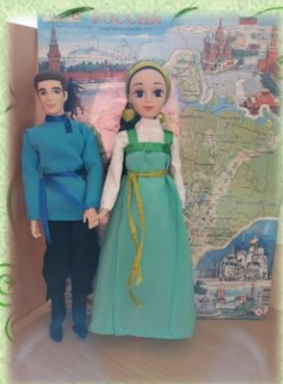
Уральский народный костюм