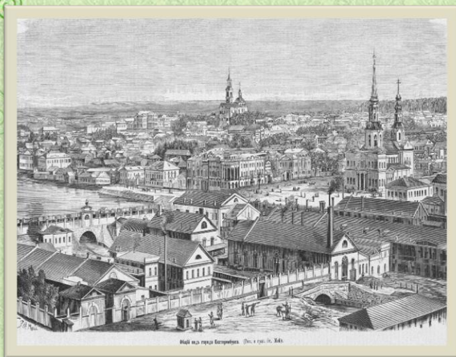
Общий вид города Екатеринбурга. Рис. и грав. Ос. Май.