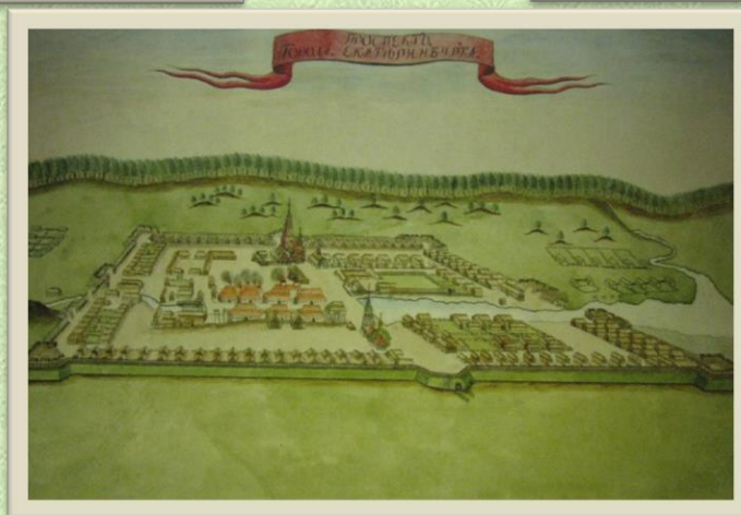
И. Ушаков. Екатеринбург . 1734год