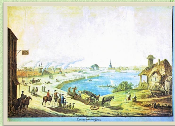
В.П. Петров. Екатеринбург (заводская плотина) 1789год.